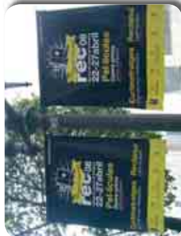
Banderoles de fanal pel Festival de Cinema de Tarragona REC 08.