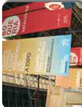
L'Asociació del Gasoil de Catalunya.