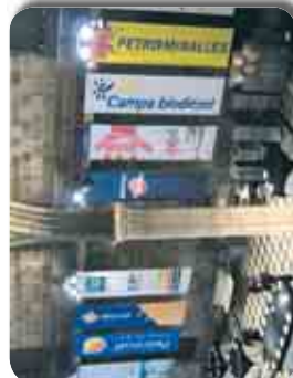
L'Associació del Gasoil de Catalunya.