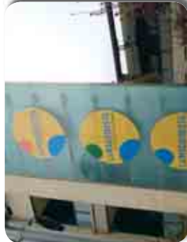
Vinilis pel centre comercial La Maquinista de Barcelona.