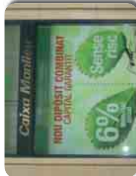
Vinilis per sota vidre per a Caixa Manlleu.