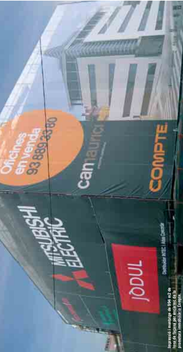
Impressió i muntatge de 994 m2 de fons de fàbrica per encarrec de la promotora immobiliària Compte.